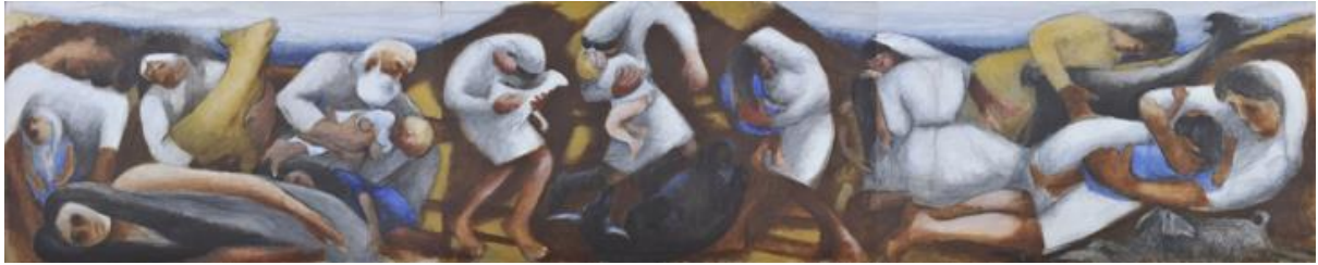
«Αγωνίες Πριν και Μετά», 1973-1977

Η απλοϊκότητα των ανθρώπων της Κύπρου και οι παραδόσεις τους ήταν το σημείο συνάντησης με τον Μικρασιάτη ποιητή ο οποίος του αφιέρωσε το ποίημα «Λεπτομέρειες στην Κύπρο», από το Ημερολόγιο Καταστροφώματος Γ΄.